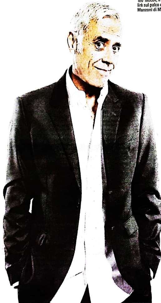
Teo Teocoli, il 29 novembre salirà sul palco del cineteatro Manzoni di Merate

proprio posto recandosi al cineteatro Manzoni tutti i lunedì e giovedì dalle 21 alle 22; è possibile farlo anche collegandosi al sito https://spet-